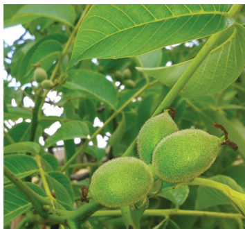
Nogueira com drupas.