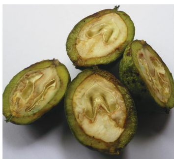
Drupa de nogueira.