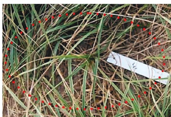
FIGURA 3. Junça com 25% de necroses.

«Uma das grandes preocupações atuais dos produtores é a procura de soluções isentas de químicos de síntese para a proteção das culturas e controlo de infestantes»