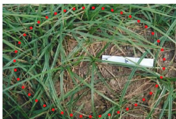
FIGURA 2. Junça com 10% de necroses.