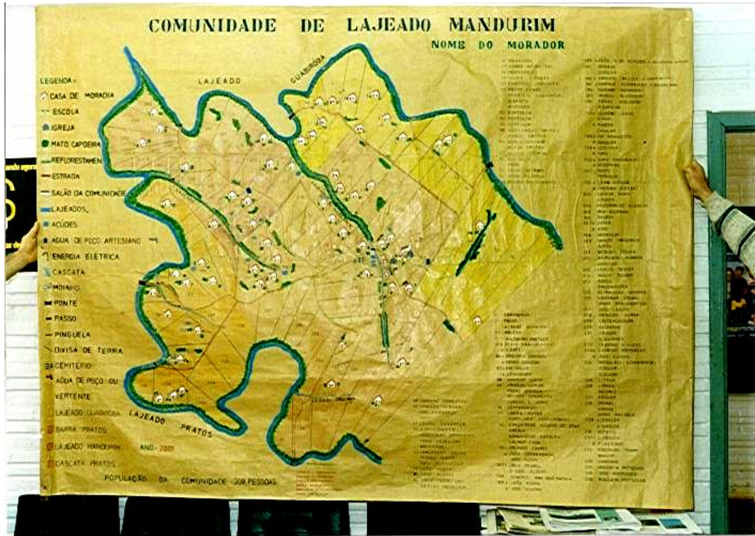
Figura 1 – Mapa da comunidade de Lajeado Mandurim.